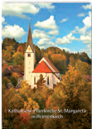
Katholische Pfarrkirche St. Margareta in Heimenkirch